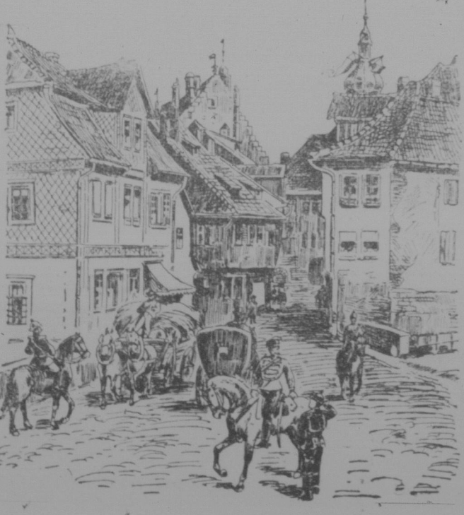
In Langensalza zur Kaiserzeit.

Den Kern des Deutmals (von Bruno Schmitz in Berlin geplant) bildet ein Kyffhäuser Thürmbau.