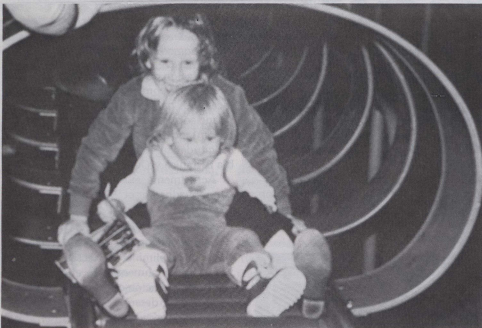
Las estructuras de juegos Hilan para niños minusválidos, como este deslizador hecho de goma suave, se integran al equipo de juegos tradicional.

Hilan para niños minusválidos, integrados a equipos de juego tradicionales. Las estructuras innovadoras incluyen columpios atrayentes puestos en movimiento mediante la acción de un columpio adyacente convencional; un campo de juegos con acceso en sillón de ruedas; platillos deslizantes que responden al revolcamiento y arrastramiento, y deslizadores sobre patines de ruedas de goma blanda. Las Estructuras de Juego Hilan atraen a todos los niños, sean o no minusválidos. Se pueden añadir al equipo regular de juegos en parques, escuelas y centros comunitarios para estimular la integración natural de los niños incapacitados y normales. El equipo de juego está fabricado y comercializado por una firma ubicada en Almonte, cerca de Ottawa.