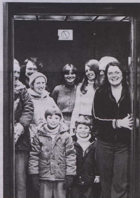
Los pasajeros escuchan a EVA, un sistema desarrollado conforme al programa. EVA es un anunciador electrónico especialmente útil para los ciegos debido a que identifica auditivamente los pisos a los usuarios de los ascensores.

El ICHV promociona los nuevos productos o métodos desarrollados como resultado de los proyectos apoyados por el PITV a las industrias de la vivienda y de la construcción.