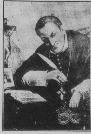
St. ALPHONSE DE LIGUORI Fondateur

A l'occasion de second centenaire de la fondation des Rédemptoristes, Notre Saint Père le Pape Pie XI a daigné adresser une lettre apostolique, entièrement écrite de sa propre main, à notre Révérendissime Père Recteur Mgr. En voici la traduction: