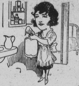
NOS BOUTEILLES A EAU CHAUDE

Voyez nos chapeaux d'enfants et surtout demandez nos prix.