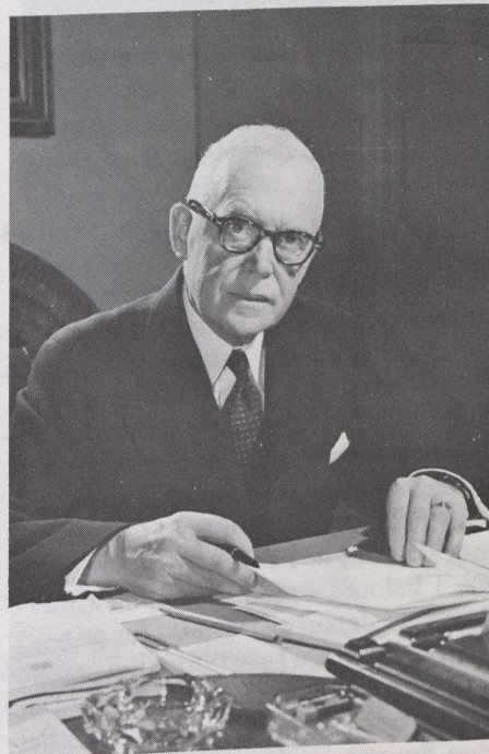
M. Louis-S. Saint-Laurent

Monsieur Louis-S. Saint-Laurent, ancien premier ministre du Canada, est décédé le 25 juillet en sa résidence de la Grande-Allée à Québec, à l'âge de 91 ans. Il a été le deuxième premier ministre canadien-français du Canada.