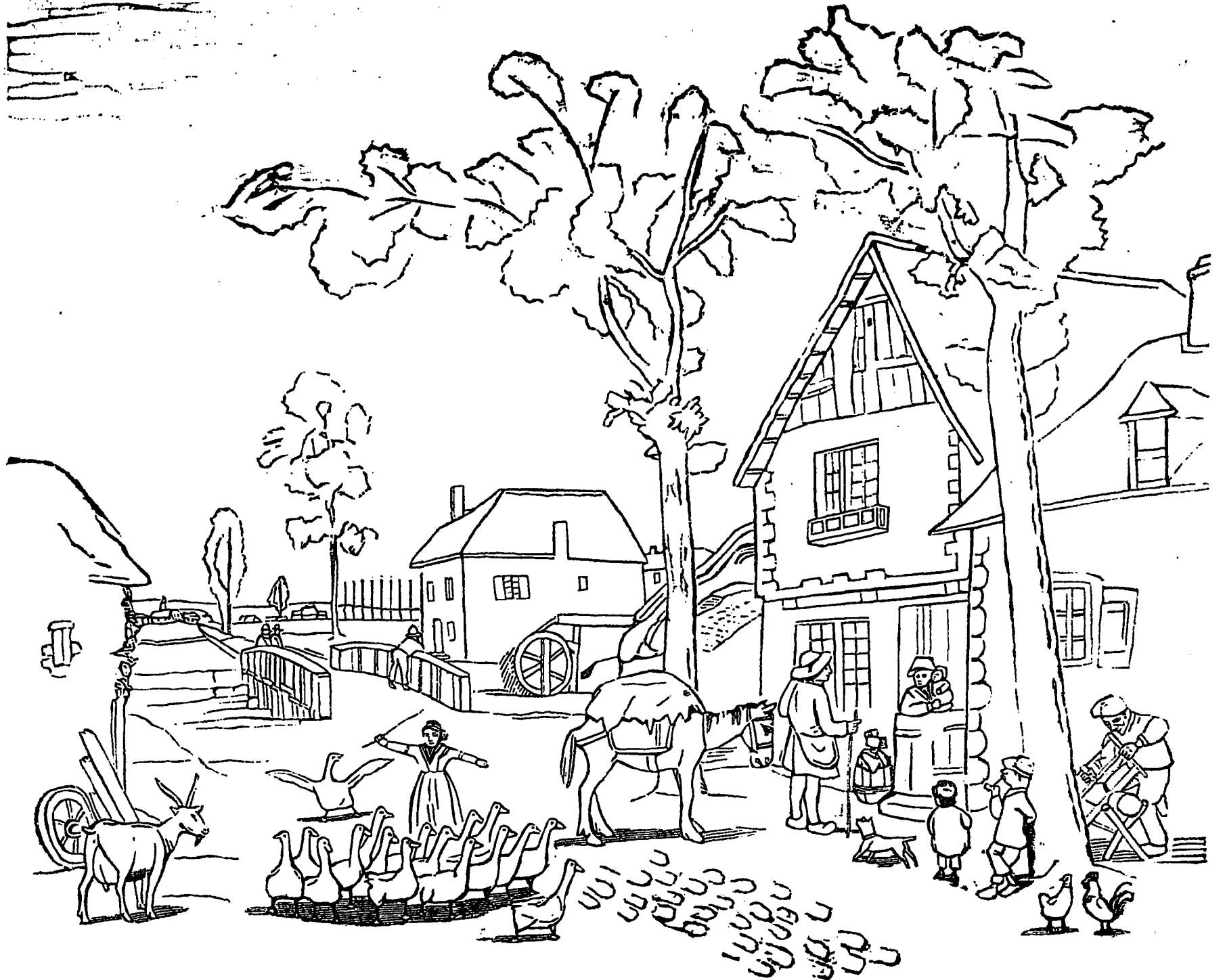
Vue de Batoche la veille de l'arrivée du général Middleton.

A Cincinnati, un affreux bandit allait payer sa dette à la société.