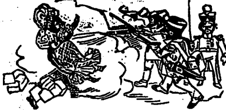
LA PRISE DE BATOCHÉ.