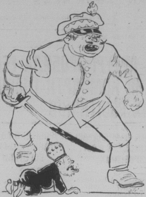
(Карикатура в київській "Пролетарській Правді".)