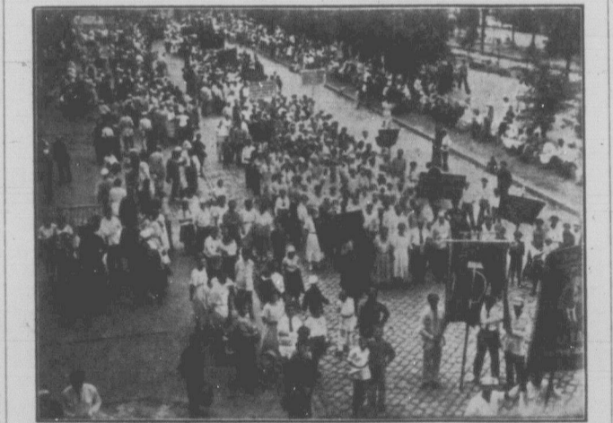
Так нині святкують на Радянській Україні Перше Травня. Зате, що згинула Перша Мая (не одна, а тисячі), нині мільйони жінок святкують це свято вільно.

— Він і не з'явився. Морфій цього не дозволить; осо-