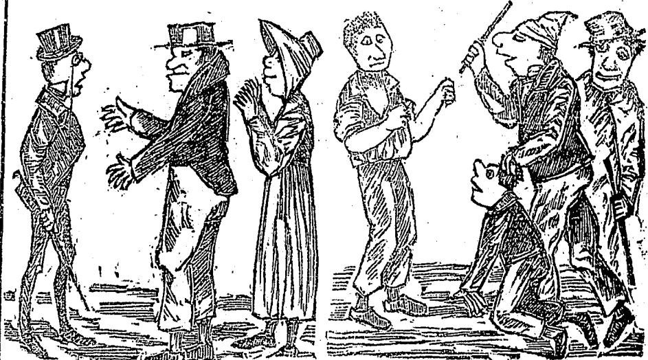
(1) Il va passer quelques jours dans son village natal.