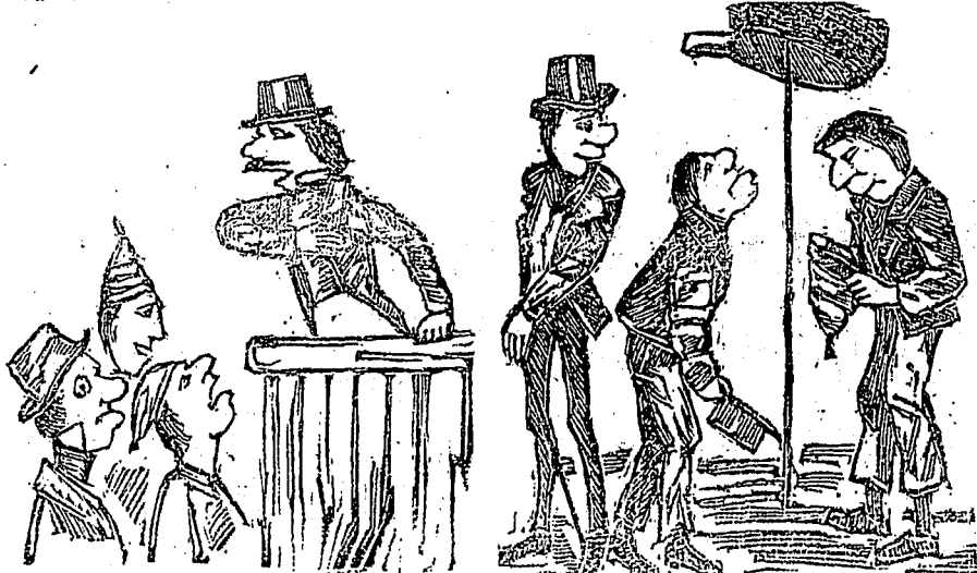
(3) Il captive les naturels de l'endroit par son éloquence ; il abonde dans le scus rouge et