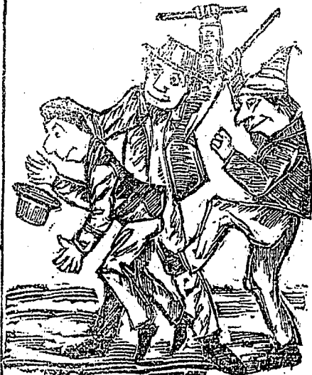
(5) Les bleus lui font un mauvais parti.