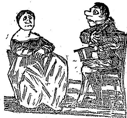
(6) Dégoûté de la politique, il adresse ses hommages à Mlle. de Grosfumier, l'héritière du plus gros fermier de l'endroit.