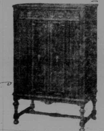
НОВЕ РАДІО-ФОНОГРАФ фірми Роджерс (комбієшин) є одним з найкращих на ринку. Радіо має 8 ламп; ший кабинет зроблений з оріхового дерева та англійського дуба. Радіо і фонограф оперує електрикою. Голосомовць має 11-цалеву трубу. Цей прекрасний мебел даємо даром для того товариша, що буде другим найвищим збирачем передплати на "Українській Робітничій Вісті". Радіо-фонограф коштує $395. Радіо куплено в фірмі J. J. H. McLEAN CO. 329 PORTAGE AVE. WINNIPEG

Нас повідомляють, що в деяких місцевостях збірка нових і старих передплат іде досить успішно. З інших знову пишуть, що зразу багатьох товаришів зацікавило справою придбання нашої газети нових передплат, але по кількох днях прай побачивши, що хтось один з них придбав кілька передплат більше і стоїть покищо найвище, вони думають, що їм не пощастить добути нагороди. Ним не треба зражуватися. Нині пощастить комусь озному здобути кількох передплатників, а завтра пощастить вам. Треба далі і невпинно працювати аж до кінця грудня. Не забувайте, що нагорода буде розділюватися не після одної тільки місцевості, але після здобутків усіх місцевостей цілої Канади. Тому далі до праці, товариші!