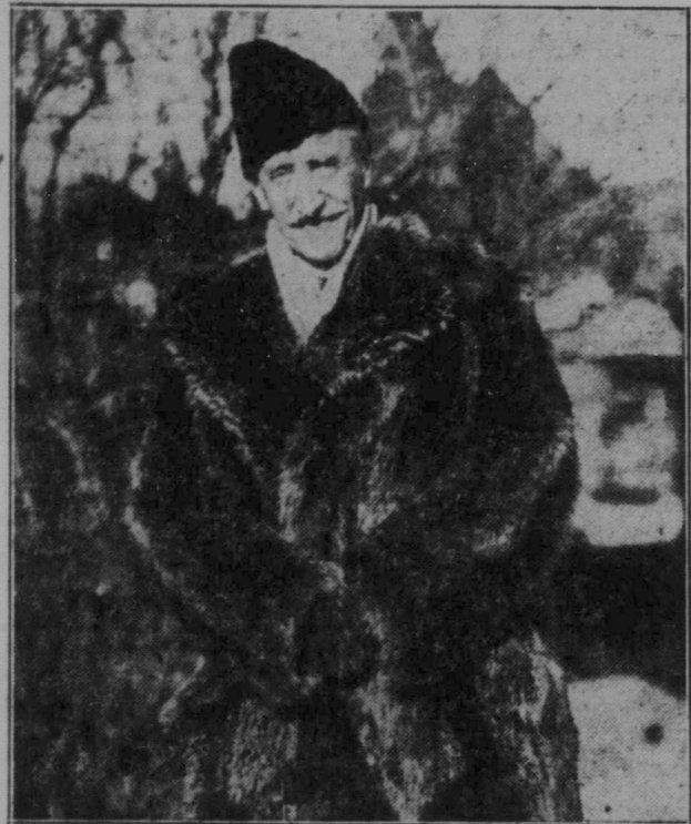
Lord Willingdon

bliva Byngs efterträdare i den händelse de canadensiska myndigheterna funno honom vara "persona grata". Och nu, efter det att många andra personers namn — Beatty, hertigen av York, Haig, Allenby och markis av Crewe — blivit nämnda, har viceguvernör-generalens befattning fallit på Lord Willingdons lot.