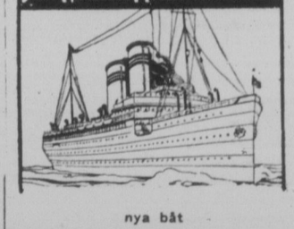
Den Norske Amerikaline... STAVANGERFJORD... BERGENSFJORD... HOBE & CO., G. W. N. A.

Swedish American Line, 396 Logan Ave., Winnipeg, Canada, 24 State Street, New York. De, som ämnar eftersända anhöriga från Sverige bora nu köpa biljetterna med direkta SVENSKA AMERIKA LINJEN P. M. Dahl Steamship Agency, 325 Logan Ave., Winnipeg, Man.