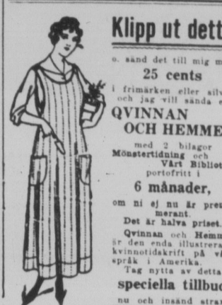
Clipp ut detta... 25 cents... Kvinna och Hemmet... 6 månader...