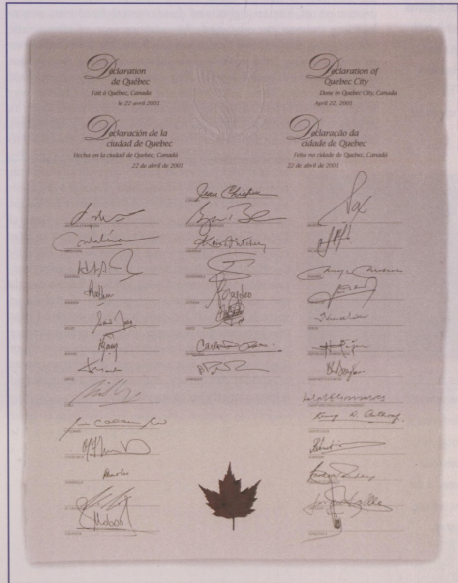
Signature page of the Declaration of Quebec City

The quintessential achievement of the Quebec City Summit, the "Democracy Clause," stated that respect for democracy is the sine qua non for participation in the Summit process. Foreign Ministers then negotiated an Inter-American Democratic Charter, which sent a powerful signal that democracy is the fundamental defining value for our Hemisphere. Together, the Clause and the Charter set new standards forming the basis for further cooperation by countries of the Americas. Whatever differences may arise, all agree that democratic institutions and practices are vital to progress.