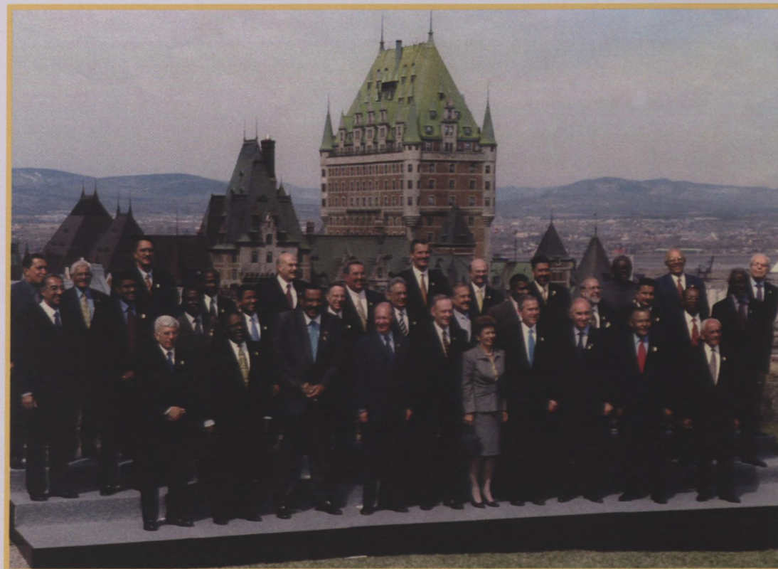
Prime Minister Chrétien, Heads of State, Government and Delegation at the Citadelle, Quebec City, April 2001.