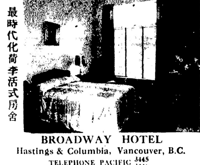
BROADWAY HOTEL Hastings & Columbia, Vancouver, B.C. TELEPHONE PACIFIC 3446

本公司茲宜僱日班鋸木瓦工二名 薪金優給如意者請來面議 National Shingle Co. 736 Taylor St. PA. 2822 電話 AL. 1086R