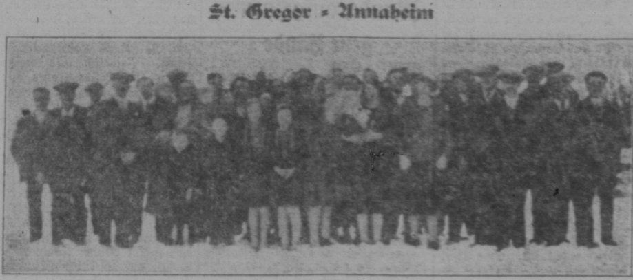
St. Gregor - Annahaim