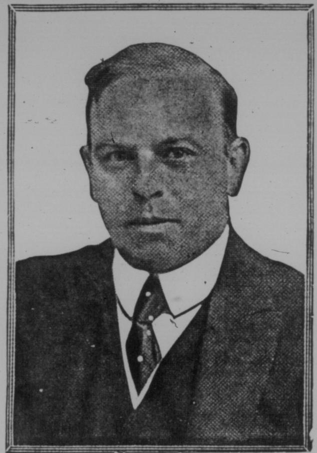
H. von Mackenzie King, Prince Albert, Sask., der frühere und zukünftige Premier von Canada.