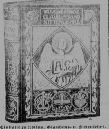
Einband zu Kollus, Glaubens- u. Sittenlehre.

Dieses Buch enthält die katholische Glaubens- und Sittenlehre in gediegener Bearbeitung und prächtvoller Form. Es ist eine Art „Katechismus“ für die Familien, an dem alt und jung sich erheben kann, und den man gewiß stets gerne wieder zur Hand nimmt wegen seines klaren Inhaltes, wegen des schönen deutlichen Druckes, und ganz besonders wegen der vielen herrlichen Bilder. Wir wollen nicht viel Worte machen über den Nutzen und über die Notwendigkeit eines solchen Hausbuches. Wir sagen kurzweg: „so ein Buch soll in jeder katholischen Familie sein.“ Monika, Donauwörth.