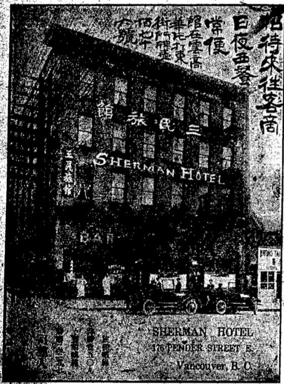
SHERMAN HOTEL 110 PENDER STREET E. VANCOUVER, B. C.