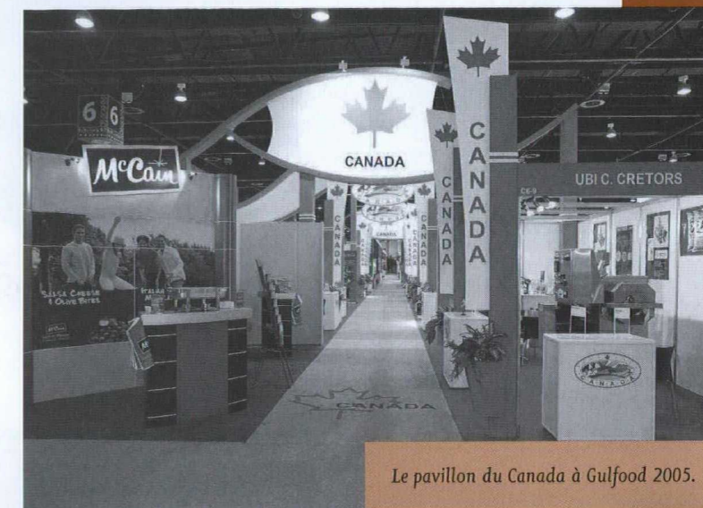
Le pavillon du Canada à Gulfood 2005.

sera assurée par des éléments graphiques et des revêtements muraux. Le coût global d'un stand de 9 m 2 dans l'un des pavillons du Canada est de 6 300 $. Toutes les demandes de réservation doivent être faites d'ici le 2 décembre 2005 et seront traitées selon leur ordre de réception.