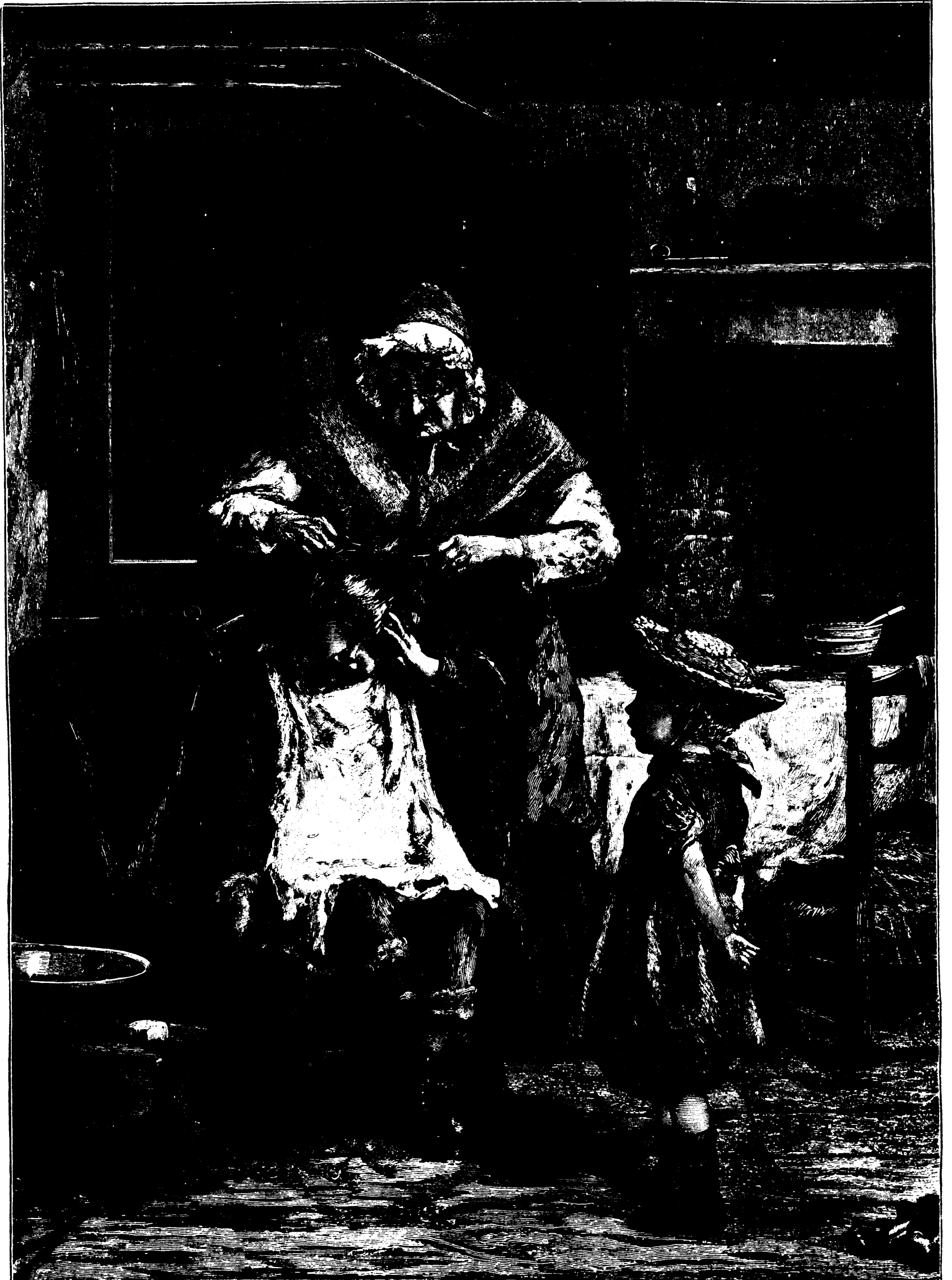
LA PATIENCE MISE À L'ÉPREUVE.