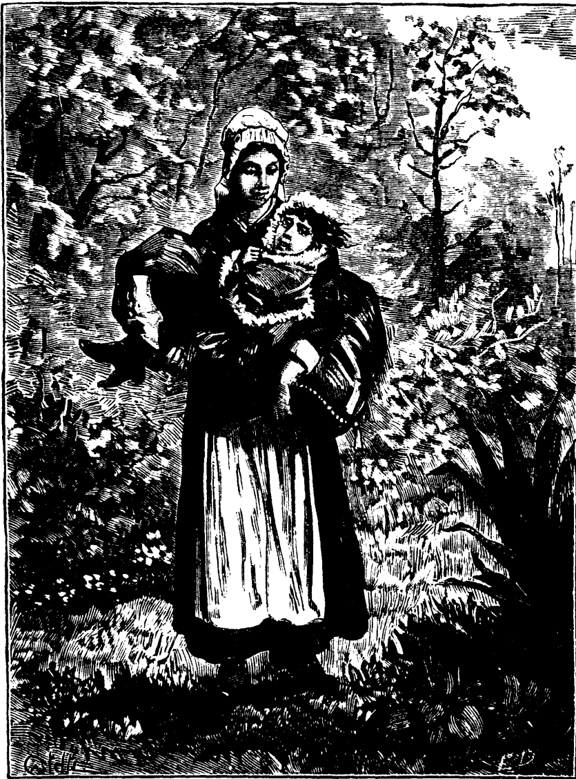
Pendant un mois elle la promena ainsi. (Voir page 77.)

—Tout à fait à ma façon, monsieur, à la façon des pauvres sabotiers, avec de la bouillie d'avoine,