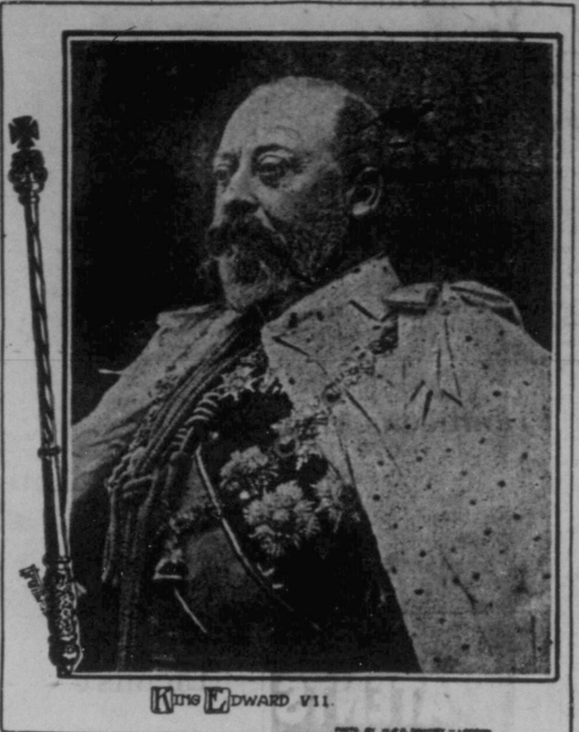
Konung Edward VII.

— Järnvägskommissionen i Ottawa har utställt en order för en korsning af Canadian Northern och Lake Superior banan på N.W. 31. 38. 4 w 3. De nödvändiga säkerhetsapparaterna skola installeras.