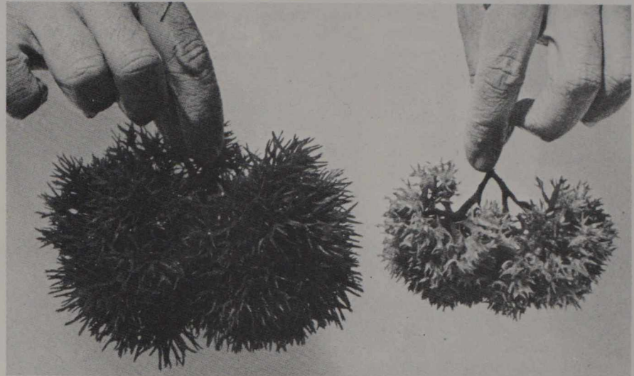
Mousses d'Irlande de même âge cultivées avec engrais (à gauche) et sans engrais.

Ces changements ont produit des effets très inégaux sur la croissance des diverses activités commerciales. Bien qu'il soit très difficile, dans ce secteur, de mesurer avec exactitude