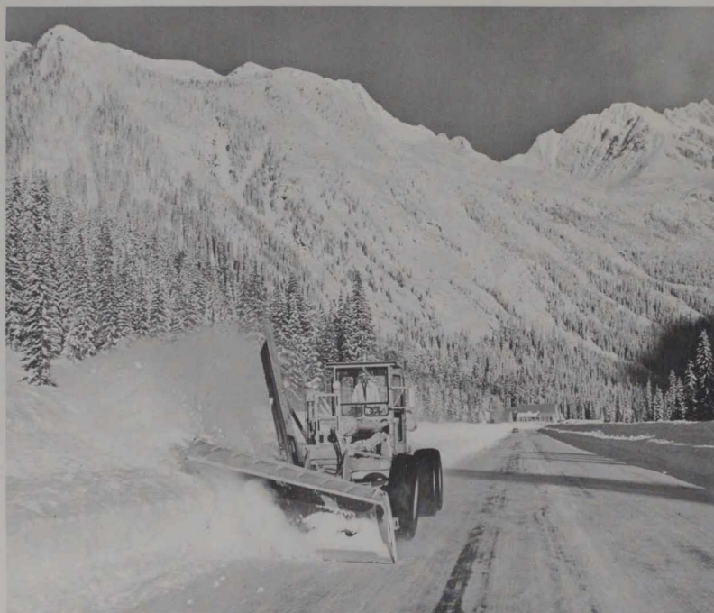
Déneigement de la route transcanadienne dans les Rocheuses (col Rogers)

Contrairement à une opinion répandue, il neige relativement peu dans les régions arctiques et subarctiques du Canada qui jouissent, dans l'ensemble, d'un climat sec quoique très rigoureux. Les chutes de neige les plus abondantes s'observent dans les régions montagneuses des Rocheuses, à l'ouest, et dans une large zone, au sud-est, qui s'étend du Lac Supérieur à Terre-Neuve en passant par le Québec.