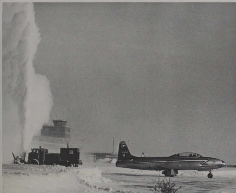
Sur l'aéroport d'Ottawa-Uplands

Aucune imperfection ne peut être admise dans le déneigement sur un aéroport qui reçoit de gros avions. Ces derniers atteignent en effet une vitesse au sol de 240 kilomètres à l'heure au moment de