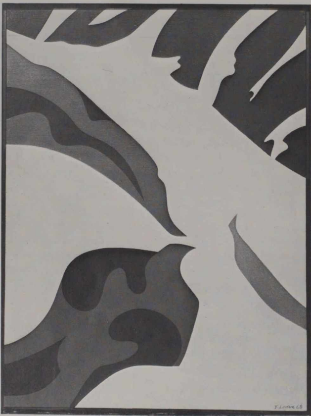
Erosions rouge-noir-violet (1968)

Le dynamisme souple et un peu simple de « Passage violet » (1967) ou de « Passage vermillon » n'est pas non plus dénué d'attrait. FIN ■