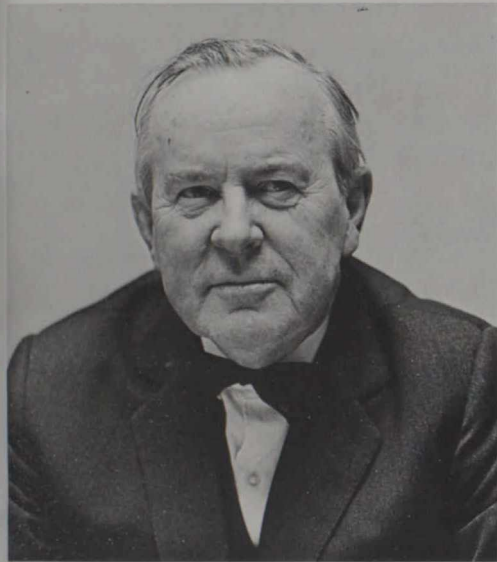
M. Lester Pearson ancien premier ministre du Canada

LE 27 octobre 1967, devant les inquiétudes que suscitait l'avenir de la coopération internationale en faveur des pays en voie de développement, le président de la Banque mondiale suggérait la tenue de « grandes assises » réunissant des personnalités très expérimentées de différents pays et des spécialistes qui évalueraient le résultat de vingt années d'aide, déceleraient les erreurs et proposeraient des politiques plus efficaces.