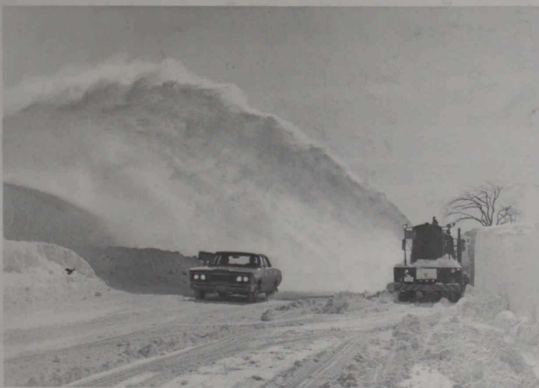
Souffleuse en action sur une route de l'Ontario