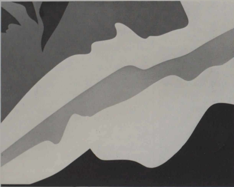
Passage rouge (1968)

A la fin de 1946, la divergence des voies apparaît suffisamment grande entre le groupe Leduc-Mousseau et le groupe Riopelle-Barbeau, qui s'étaient rejoints autour de Borduas au sein du mouvement des Automatistes, pour que Fernand Leduc sente la nécessité d'une élu-