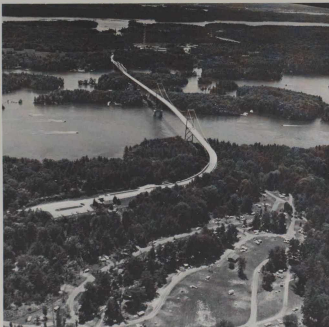
Du pont international la vue s'étend sur deux cents îles.

Une promenade en bateau dans ce royaume insulaire est inoubliable. Agréablement installé dans l'un des bâtiments confortables qui l'ont embarqué à Brockville, à Rockport, à Gananoque ou à Kingston, le voyageur évolue dans un monde insolite et cependant familier. Les