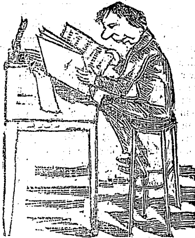
1er. mois d'étude. Il ouvre Pothier et se met à étudier le 1er. chap. des obligations.

Plusieurs de nos abonnés de la campagne ont l'ingénuité de nous renvoyer encore notre journal, après six semaines de publication. Avez-vous l'espoir, messieurs, de lire le Charivari pour rien pendant des mois entiers et, après cela, de nous payer avec ce mot : refusé ?