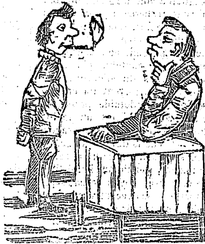
Mon fils, tu as fait ta quatrième; ton éducation est complète. Que feras-tu ? —Un avocat.