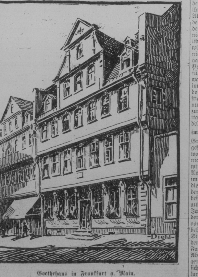
Goethehaus in Frankfurt a. Main.

Beim Angeln. Sie, warum schmieren Sie denn die großen Fische wieder ins Wasser und die kleinen behalten Sie? — Det werde ich Ihnen sagen: Ich habe zu Hause so keine Kratzen!