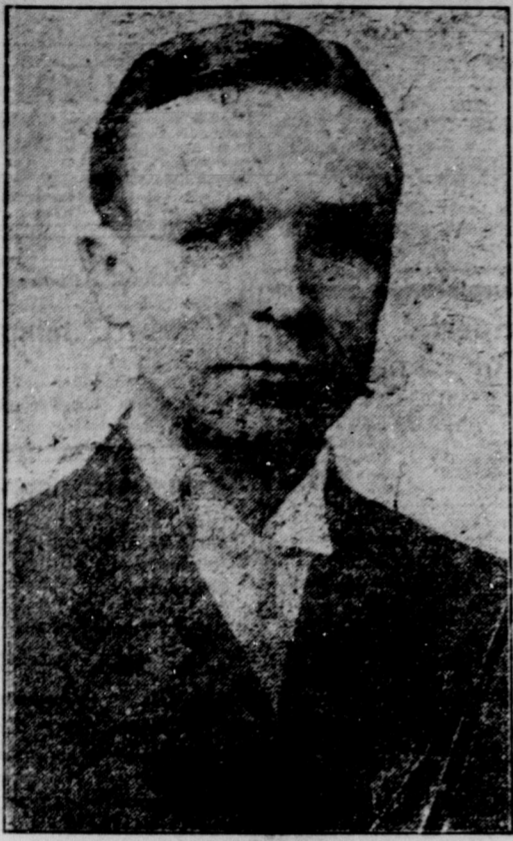
ADOLPH O. EBERHART.

Governör Adolph O. Eberhart, Minnesotas svenskfödde höfding, anlände nästkommande lördag den 22 febr. till Winnipeg för att hålla tal vid den stora middagen för att hjälpa till vid den amerikanska firningen i Washingtons födelsedag.