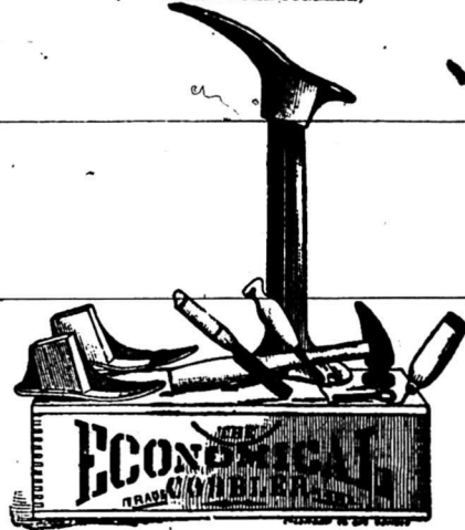
Outillage simple, pratique, à la portée de tout le monde

Le Savetier des Familles Economique (THE ECONOMICAL COBBLER)