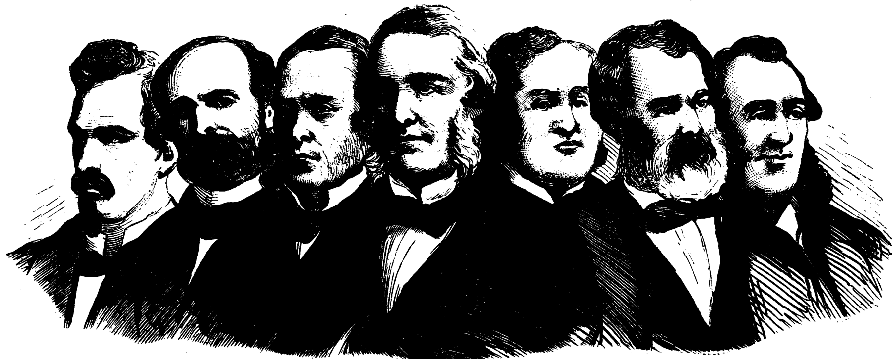
Rochefort. Glais-Bizoin. Garnier-Pagès. Étienne Arago. M. Picard. Eug. Pelletan. Jules Ferry.

Quand mes filles reviendraient de l'école, elles seraient habituées par leur mère au travail intérieur de la maison ; elles s'occuperaient avec elle du ménage, de la laiterie, de la basse-cour ; elles entretiendraient une grande propreté dans les différentes parties de la maison.