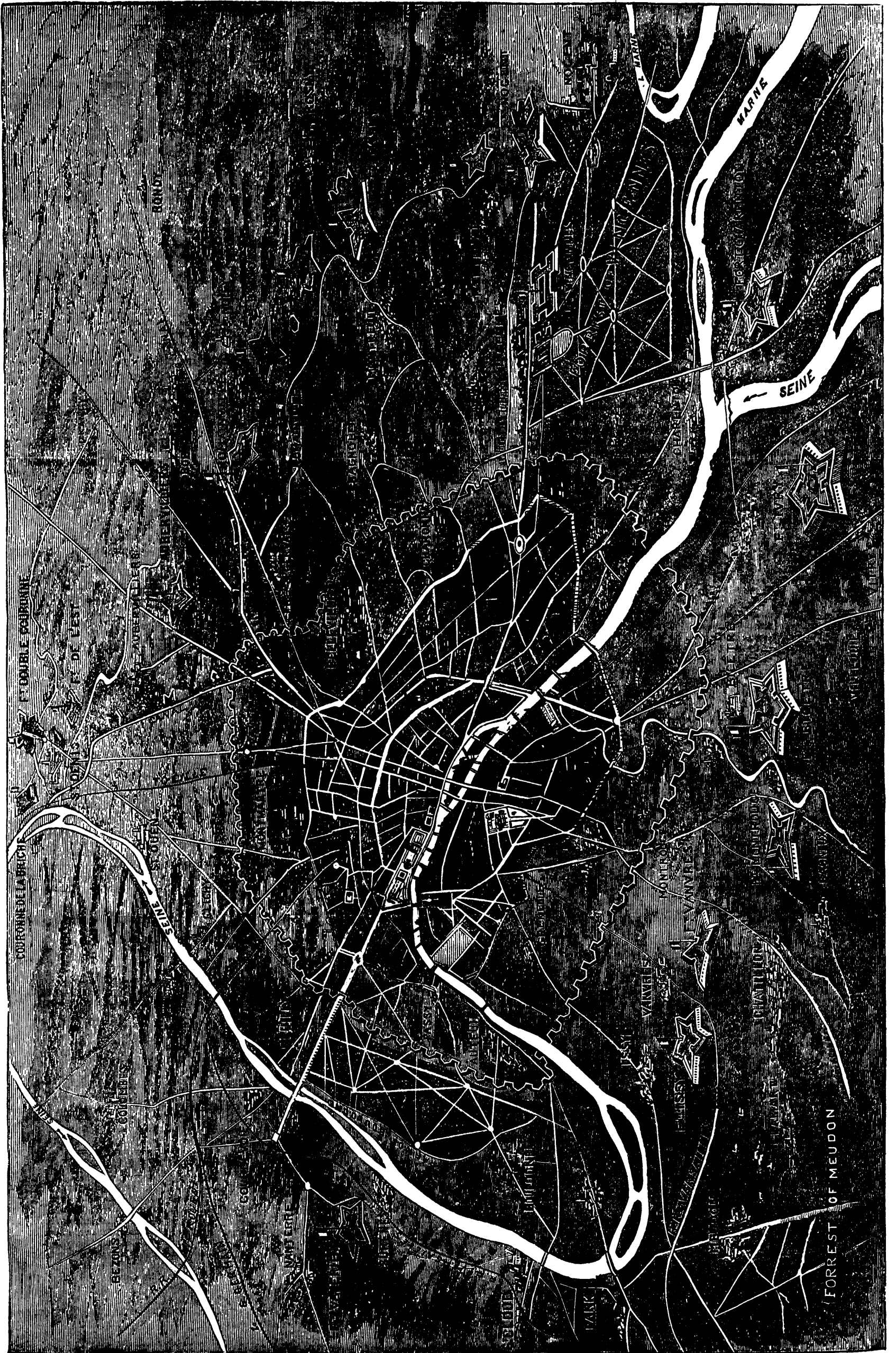
VUE DE LA CITÉ DE PARIS ET DE SES FORTIFICATIONS.—VOIR PAGE 307.