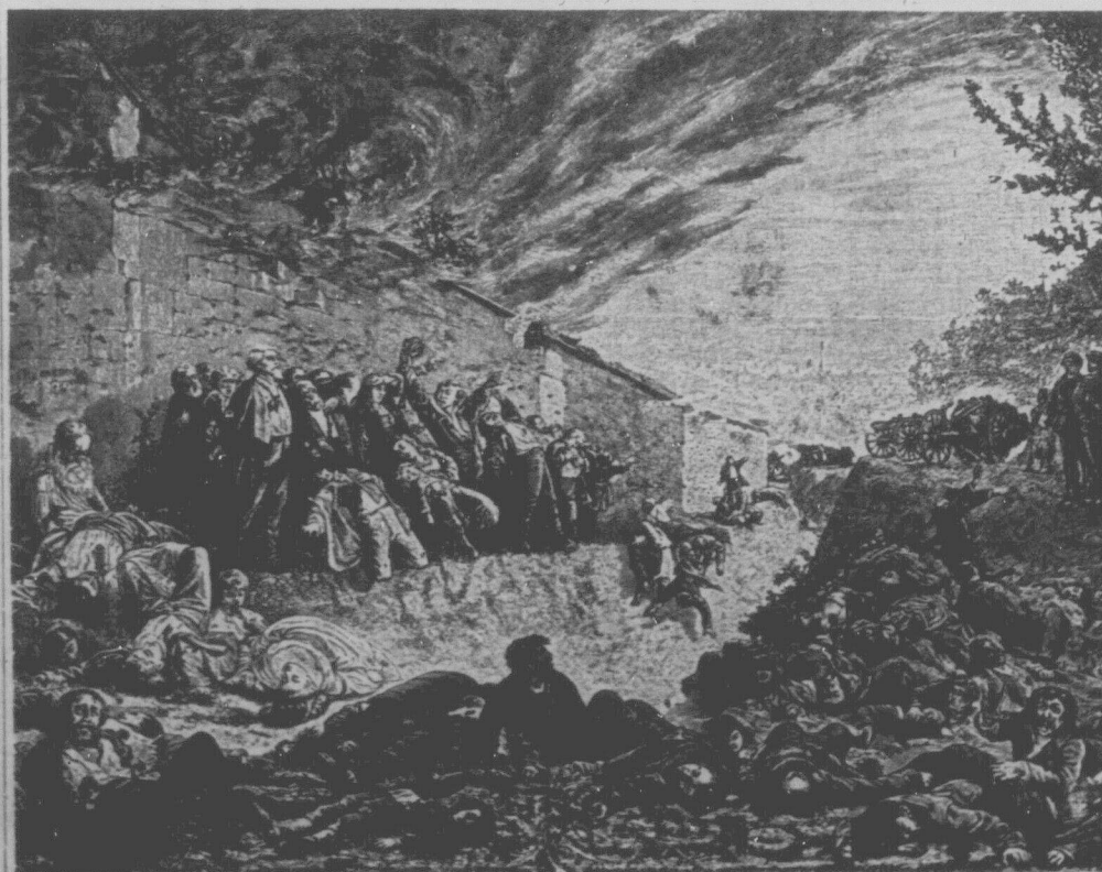
МАСОВИЯ РОЗСТРІЛ КОМУНАРІВ ПІСЛЯ ЗАХОПЛЕННЯ ПАРИЖУ АРМІЄЮ БУРЖУАЗІІ.