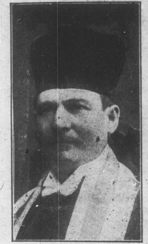
חן ישעיהו מיוועל.

דער וועלטס בעריהמטער זינגער, דער איבעראל בעליעפטר העלדערן מענאר, דער גוט בעקאנטער חן ישעיהו מיוועל קומט צו אונז קיין וויניפעג פרייטאג דעם 24סטן נאוועמבער פרישע תולדות.