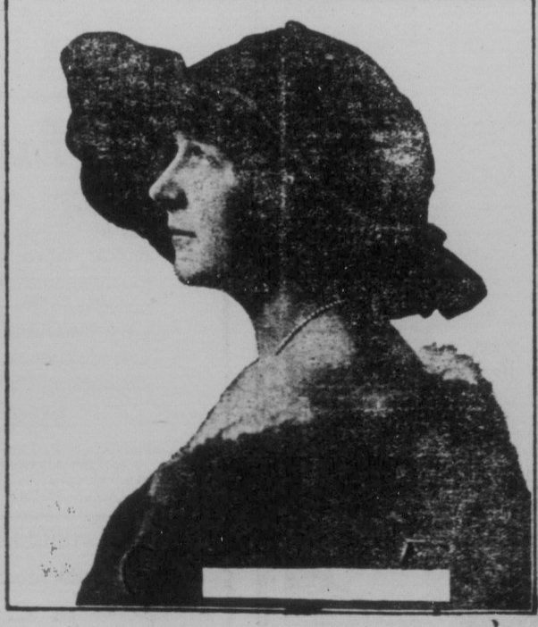
MISS MARIE LÖHR A WALKER

Henry Landru, Frankrikes Ridder i Blåskägg, är nu allvarligt sjuk.