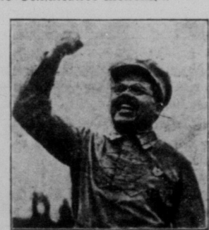
В. П. ЗАТОНСЬКИЙ. Народий Комісар Робітничо-Селянської Інспекції УС.Р.Р.

На недавньому пленумі Ц.К. Компартії України т. В. Затонського обрано головою Центрального Контрольного Комісії Компартії, а пізніше ВУЦВК признав т. Затонського на Народнього Комісара Робітничо-Селянської Інспекції.