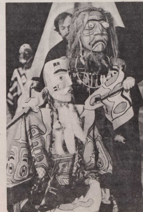
La chanteuse d'amour (debout) essaie de vendre ses chansons à Ciel Bleu.

Ciel Bleu prend Femme est une histoire à voir et à entendre.