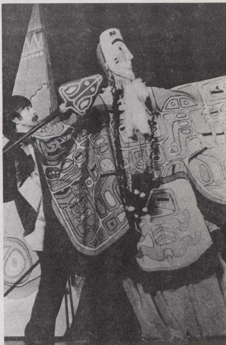
Ciel Bleu lançant le javelot.