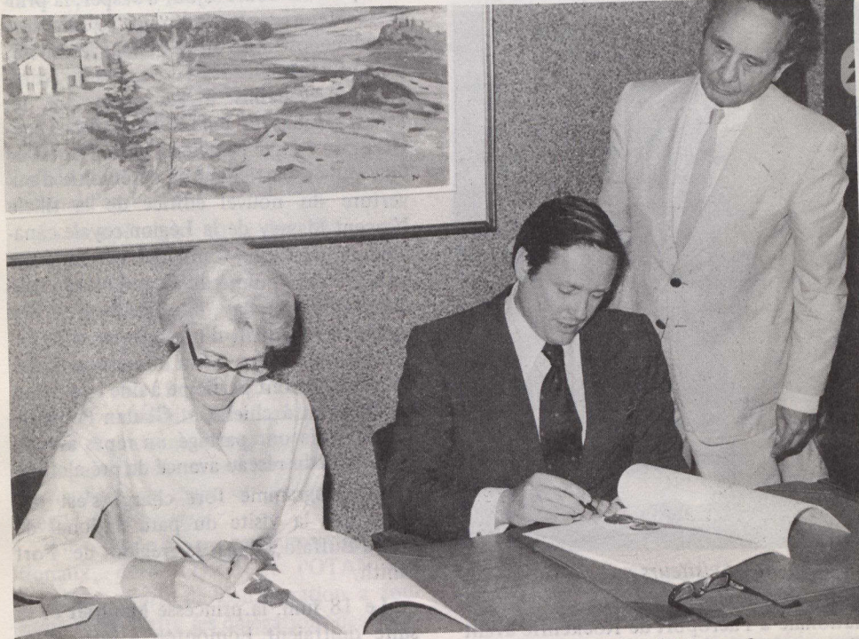
Mme Hamm-Bruecher et M. John Roberts apposent leur signature à l'Accord.

Le Canada et la République fédérale d'Allemagne ont signé un accord de coopération en matière cinématographique, le 30 mai à Ottawa. L'accord a été signé par le ministre d'État responsable des Affaires culturelles au ministère des Affaires étrangères de la République fédérale d'Allemagne, Mme Hamm-Bruecher, et par le secrétaire d'État du Canada, M. John Roberts.