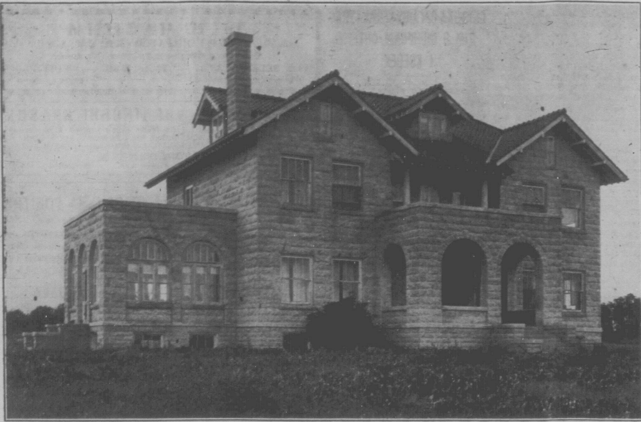
ДРУГИЙ, МЕНШИЙ БУДИНОК, КУПЛЕНИЙ ГОЛОВНИМ ЗАРЯДОМ РОБІТНИЧОГО ЗАПОМОГО-ВОГО ТОВАРИСТВА ДЛЯ ПРИЮТУ.