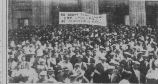
Демонстрація безробітних перед будинком парламенту у Вінніпегу 17 червня 1931 р. На образку тільки частина демонстрації.

Активізація членів і членкинь наших організацій. Про активізацію говориться на всіх наших з'їздах. Який результат? Тільки, що менші частини виконують свої обов'язки бодай частини, більша жодна не виконують своїх обов'язків і то не всі. Чому діти мусять зародити в позитивний бік, мусить бути класи в нас. Далше, частини членів і членкинь займають ТУРФДім, а зазначають в РЗТ. Чому також мусить бути зробити кінець. Правда, що частини членів, що вступає до нас позитивними часами, котра має бові здібності з послідньої боротьби на з'їзді.