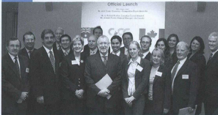
Inauguration de la Chambre de commerce australo-canadienne à Sydney.