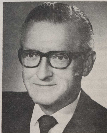
Jefes de los principales partidos políticos: (arriba izquierda) Pierre Elliott Trudeau, Liberal; (arriba derecha) Robert Stanfield, Conservador; (abajo izquierda) David Lewis, Nuevo Demócrata; (abajo derecha) Real Caouette, Creditista.

lación. Además, el Gabinete ejerce, a menudo, sus facultades por medio de decretos reales firmados por el Gobernador General.