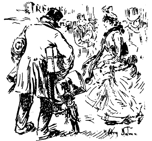
Ils ont ou elles ont la grippe