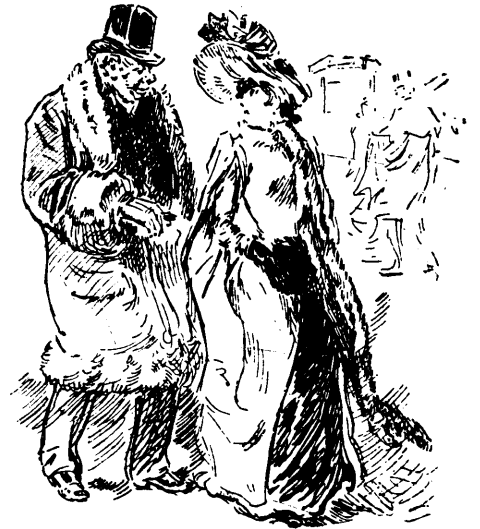
Il a ou elle a la grippe