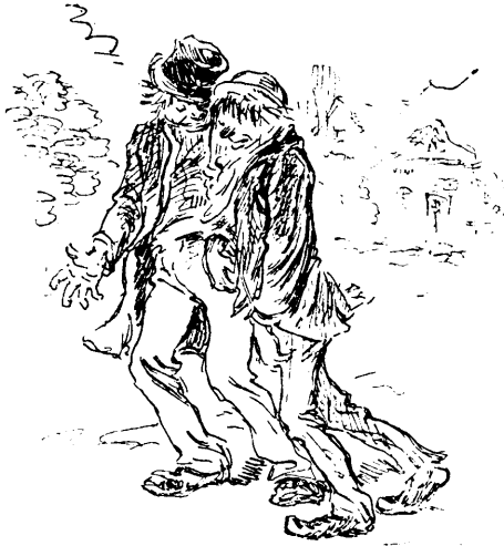
T'as la grippe