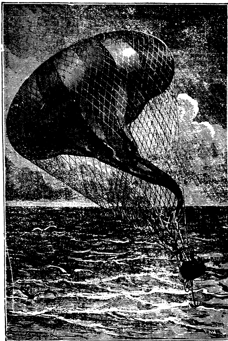
Le ballon se dégonflait de plus en plus. —Page 309, col. 2

—N'ayez pas peur, me dit l'inconnu. Il n'y a que les imprudents qui deviennent des victimes. Olivari, qui périt à Orléans, s'enlevait dans une montgolfière en papier ; sa nacelle, suspendue au-dessous du réchaud et lestée de matières combustibles, devint la proie des flammes ; Olivari tomba