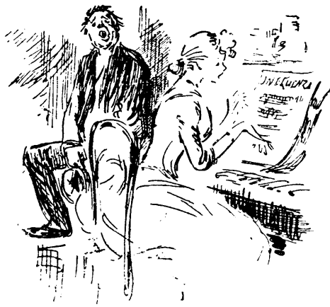
Vous avez la grippe