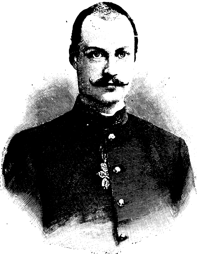
L'ARCHIDUC-LEOPOLD-SALVATOR DE TOSCAN