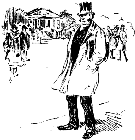
Nous avons la grippe