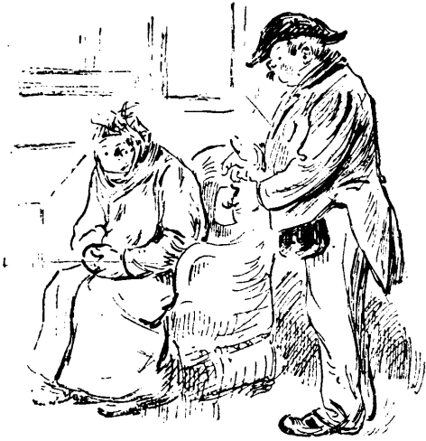
J'ai la grippe.