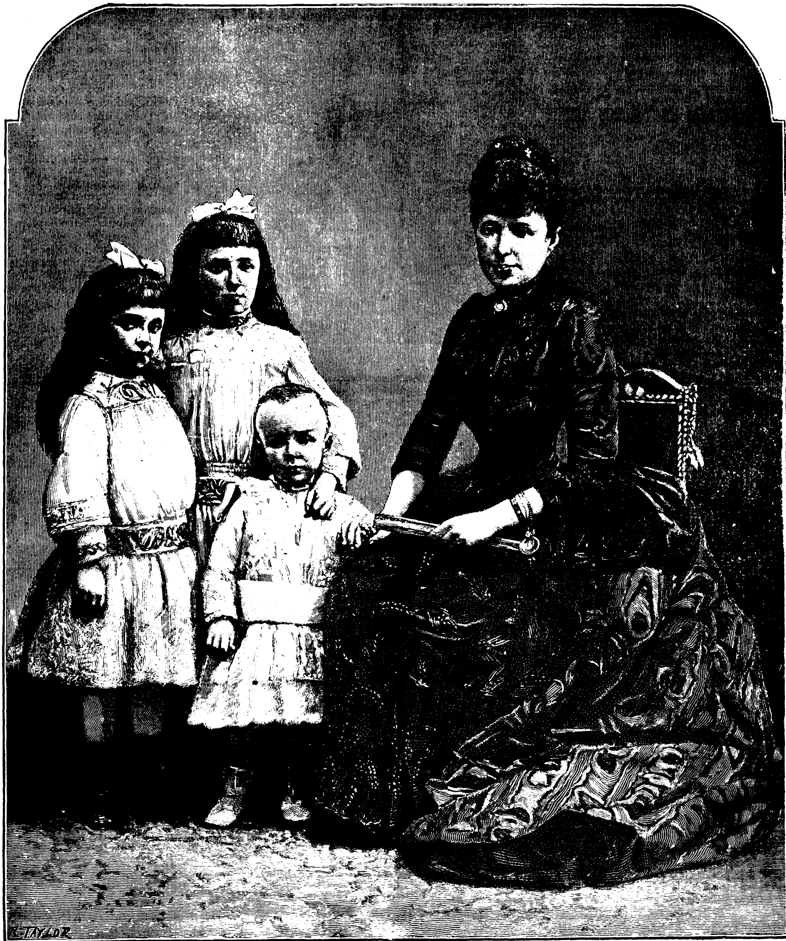
LA FAMILLE IMPÉRIALE D'ESPAGNE

La ligne, par insertion - - - - - 10 cents Insertions subséquentes - - - - - 5 cents Tarif spécial pour annonces à long terme