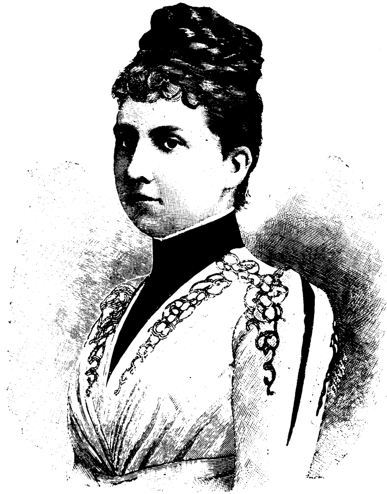
LA PRINCESSE BLANCHE DE BOURBON