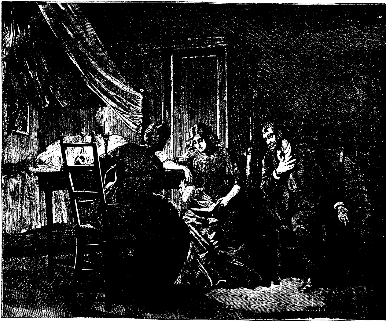
Merced pleurait silencieusement.—Voir page 79, col. 2.

Elle n'acheva pas sa phrase, et cacha son visage