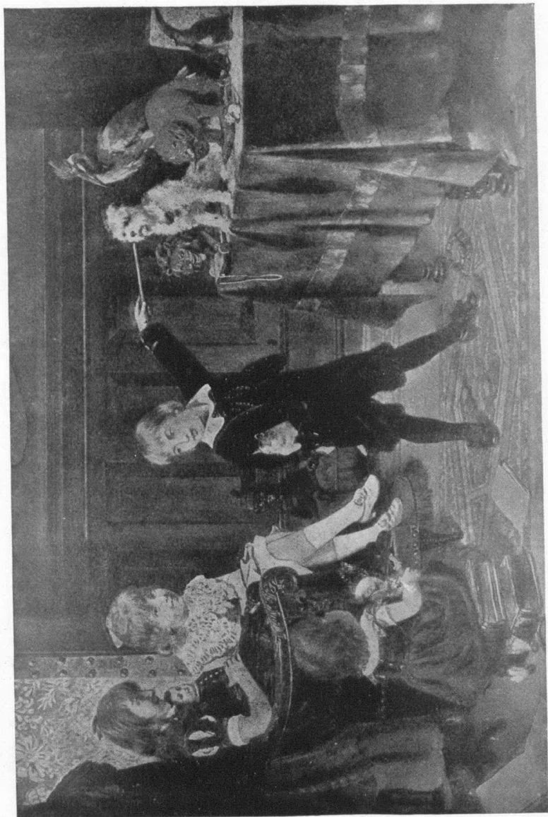
(Voir "La Rédaction à la petite école" au chapitre de la Méthodologie, présente livraison)