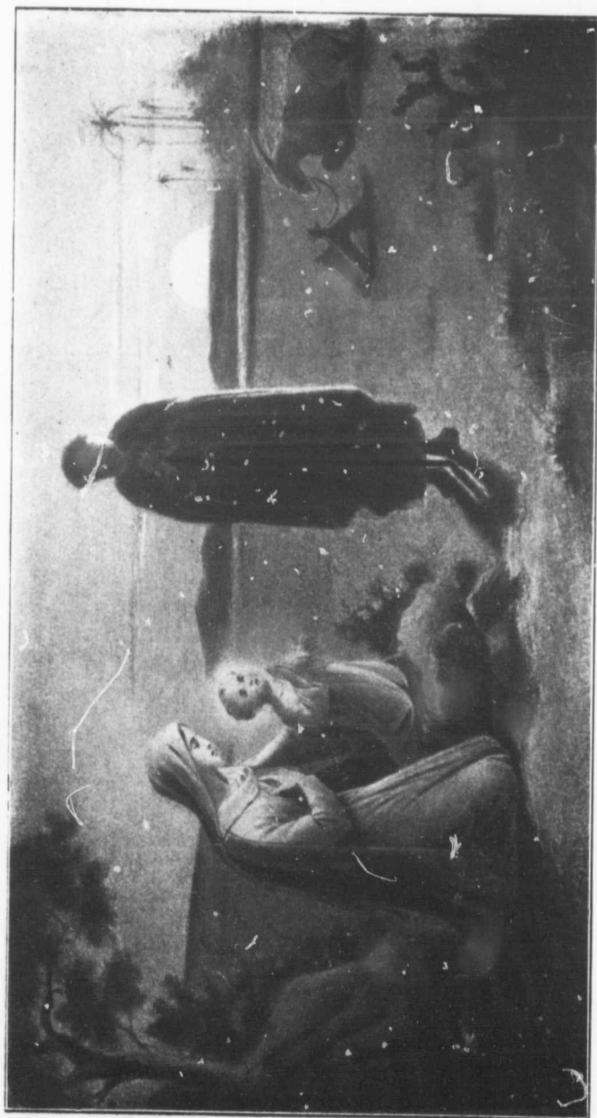
La Prière du Soir.