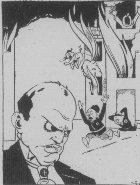
Муссоліні — "апостол миру" на десять літ.

Якщо потім всі вони утворять блок проти інших держав, вони примусять інші народи своєю чергою об'єднатися і таким чином одна проти одної стоять дві ворожі групи. Від часу війни багато говорилось про добрі наміри, складалися та відкидалися плани. Питання про репарції висувало на міжнародно арені різні плани та народило плани Доса та план Понга. Росіяні своїм п'яти-