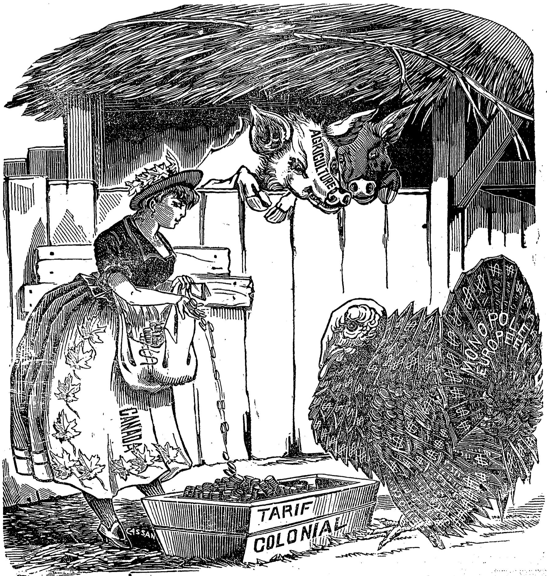
Madame Canada—Bientôt Noël (l'annexion) arrivera ; alors, je cesserai de t'engraisser.