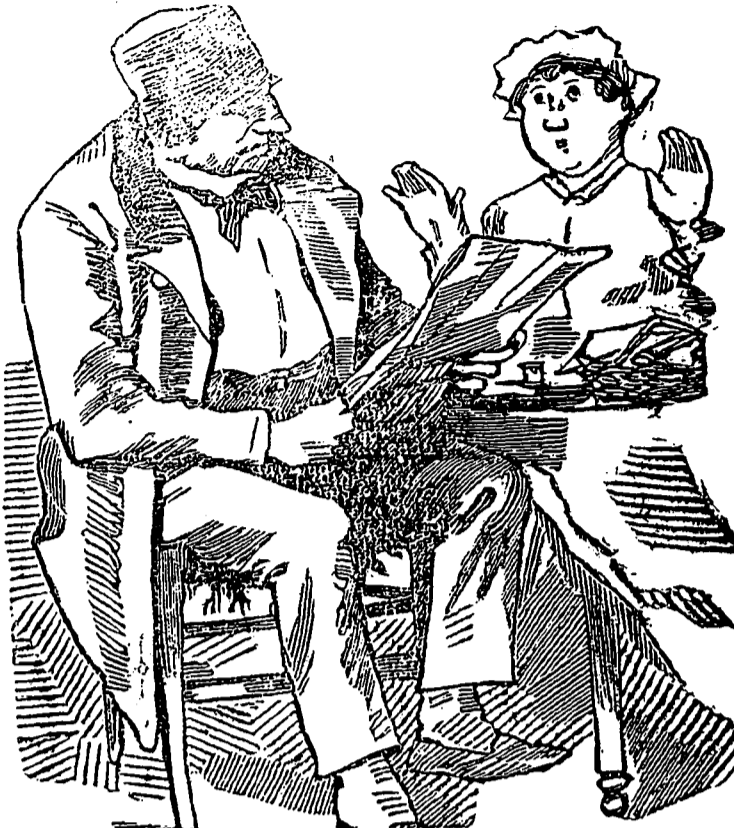
Le bonheur de la lecture du Passepartout.