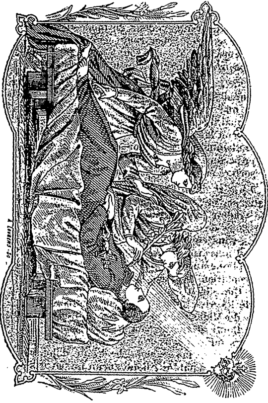
MORT DE SAINT LOUIS DE GONZAGUE, MARTYR DE LA CHARITE.