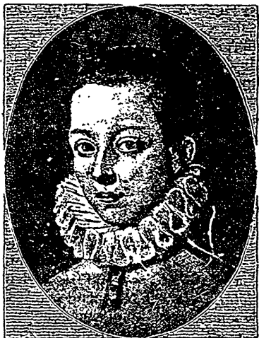
Portrait de saint Louis à 14 ans.

« possible dans toutes les conditions, le plus puissant, « puisqu'il obtient de DIEU la grâce; sans laquelle « travaux et prédications apostoliques restent sans « fruit. A la prière, partie souvent de quelque âme « ignorée, les apôtres doivent la lumière qui éclaire « les esprits, l'onction qui touche les cœurs, la force « qui ébranle et entraîne les volontés dans la voie du « bien. »