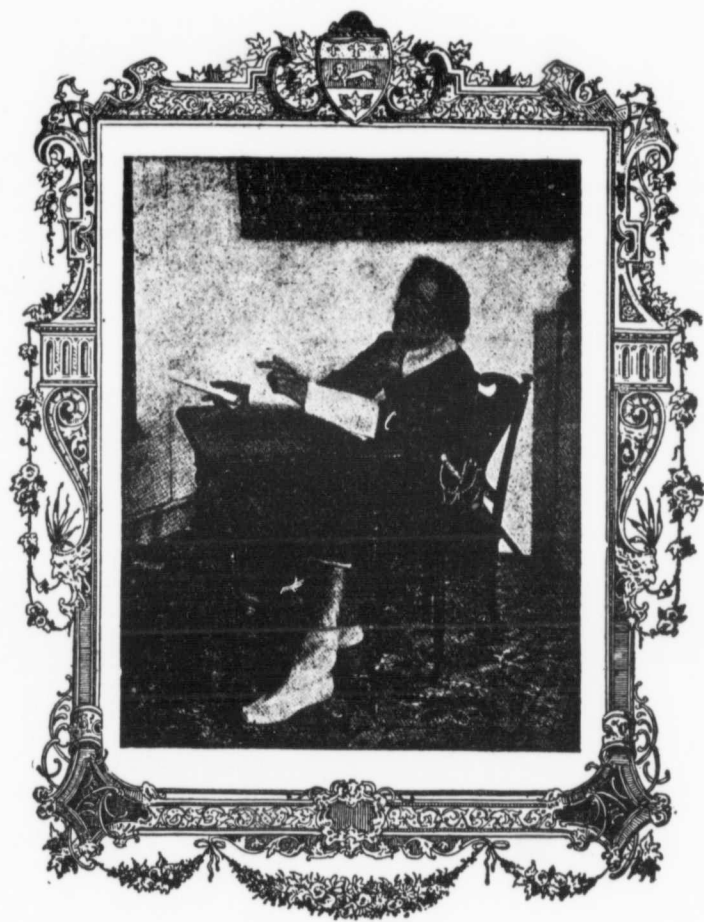
PAUL DE CHOMEDEY Sieur de Maisonneuve.