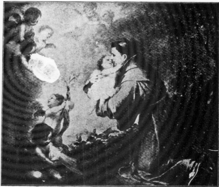
ST-ANTOINE DE PADOUE (Fête le 13 juin)