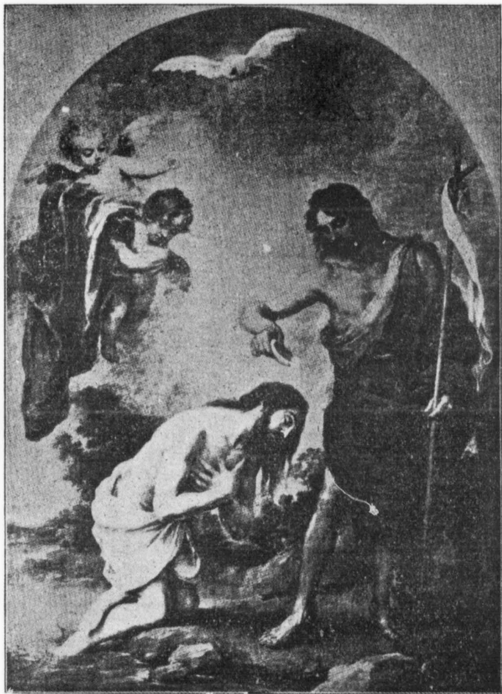
LE BAPTÊME DE J.-C. PAR JEAN-BAPTISTE.