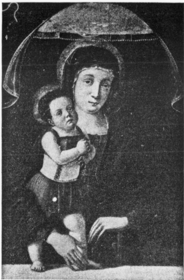
LA VIERGE ET LE BAMBINO.—G. Bellini