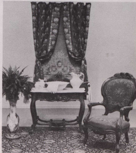
Ensemble victorien néo-rococo. Fauteuil fabriqué par Philippe Valières vers 1870.

En 1980, l'Exposition a fait partie de l'Exposition nationale du Canada.