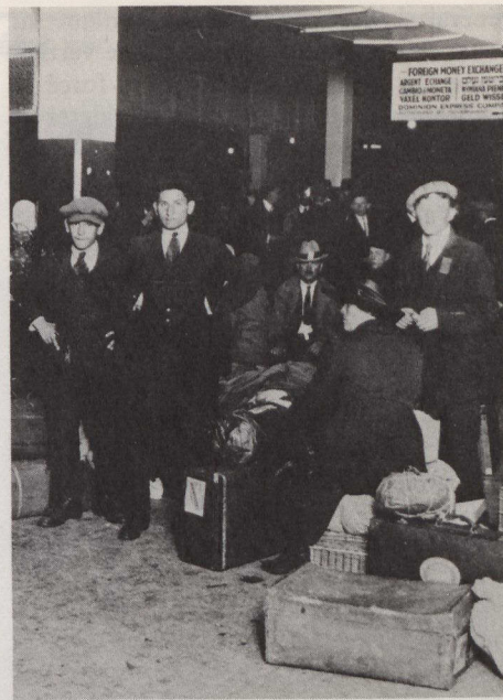
Arrivée d'immigrants au début du siècle.

gnait un sommet, le pourcentage d'immigrants célibataires était exceptionnellement élevé, une plus grande proportion des intéressés avait rejoint les rangs de la population active et les secteurs d'emploi favorisés étaient la construction, la fabrication et les travaux mécaniques. Toutes ces caractéristiques reflétaient fidèlement le climat économique du milieu des années 50 alors que l'augmentation du volume des investissements, le développement des industries manufacturières et la construction d'installations hydro-électriques augmentaient les besoins du Canada pour ces catégories de travailleurs. Les taux de chômage relativement bas enregistrés durant cette période démontrent avec quelle facilité l'économie canadienne pouvait absorber les travailleurs immigrants.