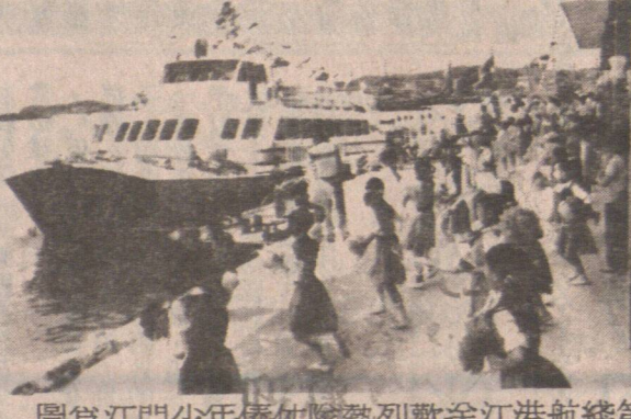
圖為江門少年儀仗隊熱烈歡送江港航線第一班旅客登上「明珠湖」號雙體高速客輪。

廣東江門市至香港直達客運航線，經國務院批准，於五月十一日正式通航。當天在江門市北街新運碼頭舉行通航典禮。擔任江港直達客運的是江門兩艘「明珠」輪，「銀洲湖」高速雙體客輪，每日上午八時十五分及下午二時十分從江門開往香港，全線九十九海浬，航程四個小時。該輪設有五百五十個座位，客艙寬敞明亮，座位舒適。設有空調設備、小賣部、快餐供應等，為廣大華僑、港澳同胞旅遊、探親提供方便。