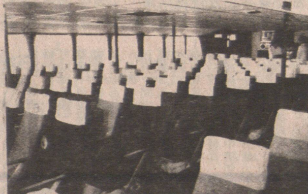
圖為雙體高速客輪寬敞的客艙。