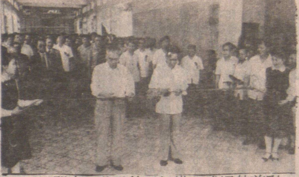
圖為江門市市長會發等為江港正式通航剪彩。

廣東江門市至香港直達客運航線，經國務院批准，於五月十一日正式通航。當天在江門市北街新運碼頭舉行通航典禮。擔任江港直達客運的是江門兩艘「明珠」輪，「銀洲湖」高速雙體客輪，每日上午八時十五分及下午二時十分從江門開往香港，全線九十九海浬，航程四個小時。該輪設有五百五十個座位，客艙寬敞明亮，座位舒適。設有空調設備、小賣部、快餐供應等，為廣大華僑、港澳同胞旅遊、探親提供方便。