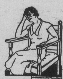
Par respect pour le désir de Mme A. L., nous ne publions que les initiales de son nom; sous cette forme, elle est sûre de ne pas être reconnue.

Ma page d'album, déjà je l'avais vu. En revenant vers mon secteur, on m'attendait des responsables de plus en plus lourdes, je regardais les nuages s'enfuir à l'horizon. —D'où viens-tu, beau par vent? —Alors... —Alors, pitié, prudence, charité! V. Germain, pte.