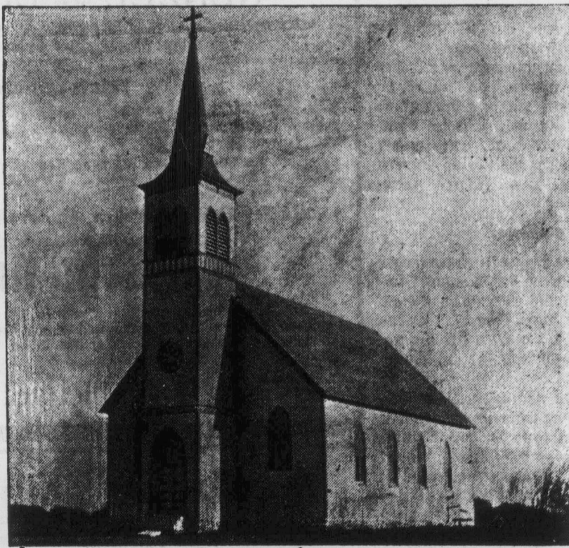
Die neue Kirche der Maria Himmelfahrts-Gemeinde in Dead Moose Lake, Saskatchewan.

ganze Woche in Anspruch. Die Frau oder die Kinder mußten dann allein zurückbleiben, die wenigen herbeigeschafften Habseligkeiten bewachen und den armen Haushalt auf der Heimstätte führen. Auch waren die Wege nach Kosthern nicht mit Ziegelsteinen gepflastert, denn woher sollten gepflasterte Wege in einem bisher noch völlig unbewohnten Lande kommen? Ferner zeigte die Sonne nicht immer ein freundliches Gesicht. Der Pionier mußte ein Haus für sich und seine Familie einrichten und einen Stall für seine Tiere bauen. Er mußte Bau- und Brennholz herbeischaffen und Land brechen, um dasselbe im darauffolgenden Frühjahr einjäten