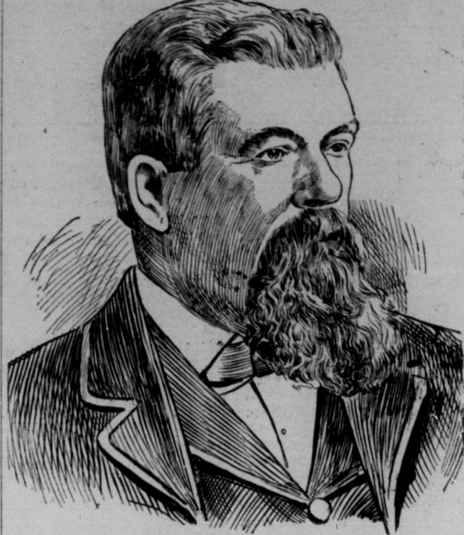
Ex-Premier Hon. Thos. Greenaway, Manitoba Liberal Party leader.

Det är alldeles som att kasta bort pängar, när ni kastar ifrån er SNOW SHOE TAGS, som finnas på hvarje kaka Pay Roll Cheving Tobacco. Gåm dem och ukanutvälja er en vaaker present ur 150 stycken olika saker. "Tags" äro goda till den 1 jan. 1902. Begär illustrerad premiekataloger händare