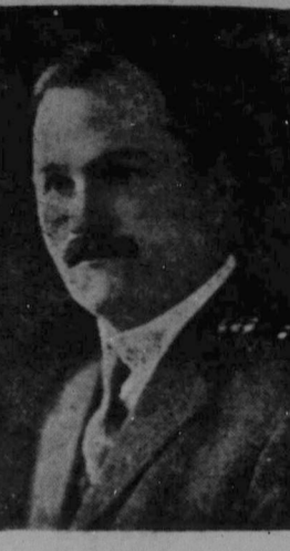
Premiärminister C. A. Dunning, av Saskatchewan kungör ett överskott i sitt tal över budgeten.