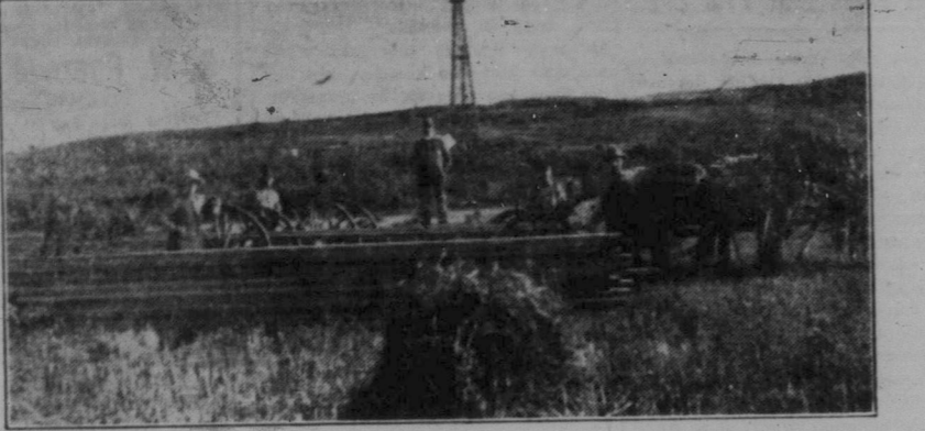
Maple Leaf Oil Co:s plats vid Fabyan. No. 1 brunn ses i bakgrunden. I förgrunden ser man timmer, som skall brukas vid arbetet på brunn no. 2.