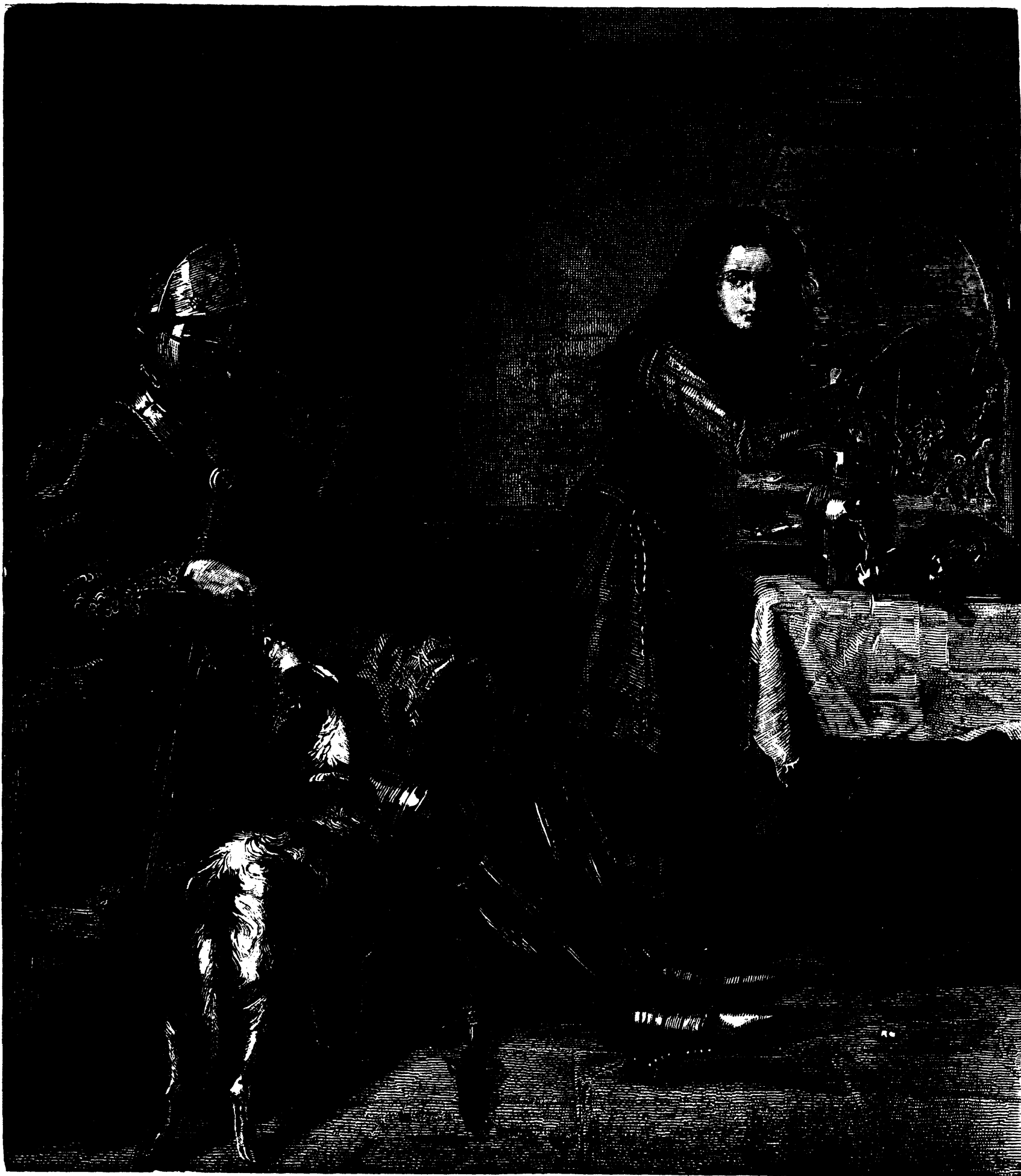
JEANNE D'ARC ÉCOUTANT LE RÉCIT DES MALHEURS DE LA FRANCE PAR UN VIEUX SOLDAT QUI ARRIVE DU CHAMP DE BATAILLE.

— Curgue, ajoutait vivement M. le duc de Persigny.